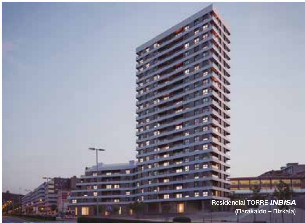
Residencial TORRE INBISA (Barakaldo - Bizkaia)