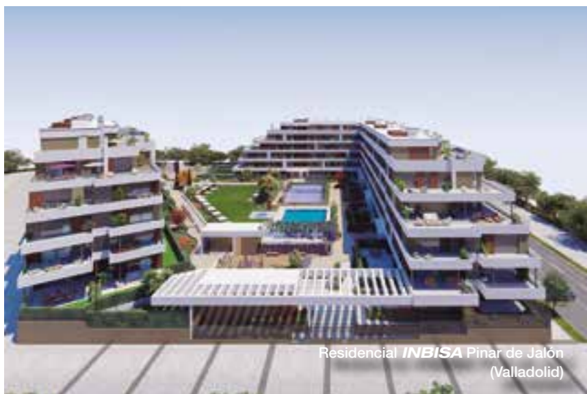
Residencial INBISA Pinar de Jalón (Valladolid)