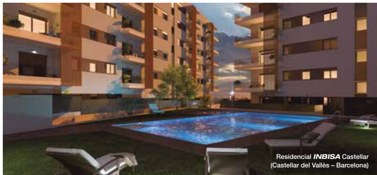
Residencial INBISA Castellar (Castellar del Vallès - Barcelona)