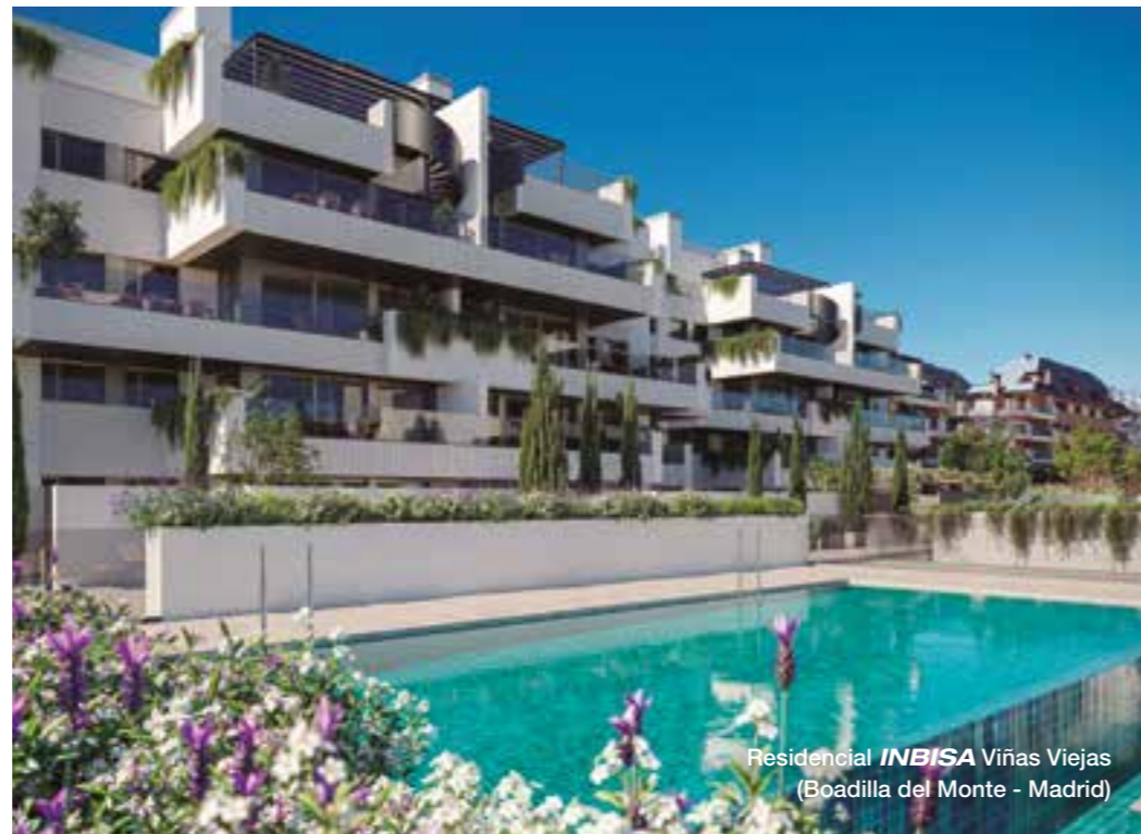
Residencial INBISA Viñas Viejas (Boadilla del Monte - Madrid)